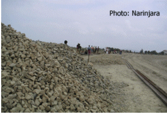
စစ်တွေနှင့် နည်းပညာ တက္ကသိုလ်အကြား ရထားလမ်းဖောက်လုပ်နေစဉ်

မောင်ရမ္မာ (နီရန္တရာ) စစ်တွေ-အမ်း ရထားလမ်းတွင် ပါဝင်သော စစ်တွေမြို့နှင့် နည်းပညာတက္ကသိုလ် အကြား ရထားလမ်းပိုင်းကို ဖောက်လုပ် နေရာတွင် အလုပ်သမားများကို ငွေကြေး တစ်စုံတရာ မပေးဘဲ အချိန်ပို ခိုင်းစေ နေသည်။