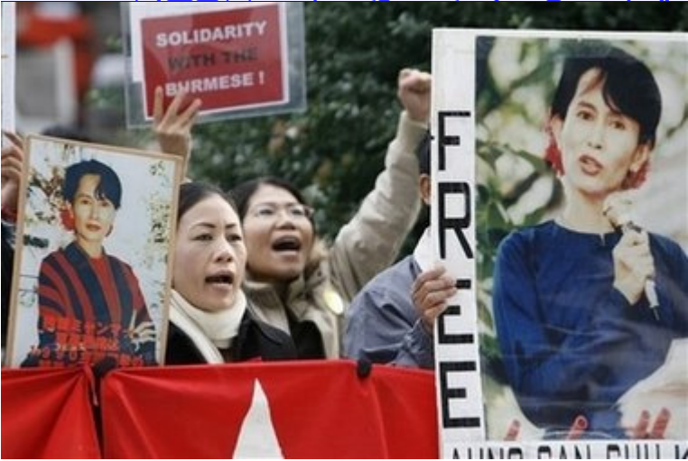
ဆန္ဒပြပွဲ ဖိတ်ကြား လွှာ

ဒေါ်အောင်ဆန်းစုကြည်နဲ့ နိုင်ငံရေးအကျဉ်းသားများလွတ်မြောက်ရေး လှုပ်ရှားမှု