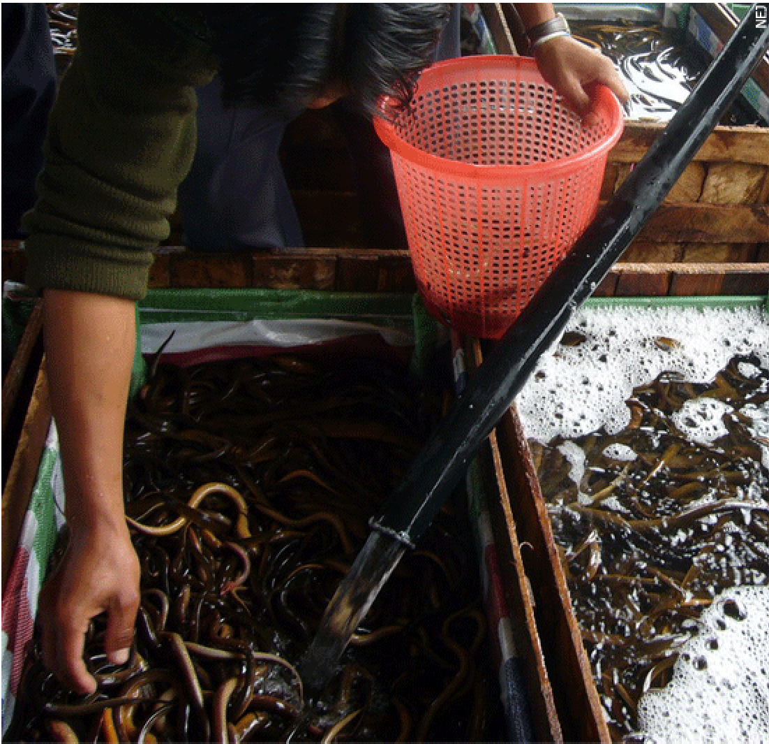
ဈေးကွက်သို့ ပို့မည့် ငါးရှဉ့်များ ရွေးနေပုံ

အန်ဒီအေ (ကချင်) အဖွဲ့က မေ (၁၈) တွင် စစ်အစိုးရနှင့် ဆွေးနွေးတင်ပြမည့်အချက်များကို ကချင်ပြည် လွတ်လပ်ရေးအဖွဲ့ကလည်း လေ့လာနေပြီး ၎င်းတို့အဖွဲ့က မေ (၂၀) တွင် စစ်အစိုးရထံ တွေ့ဆုံအကြောင်းပြန်မည်ဟု သိရသည်။