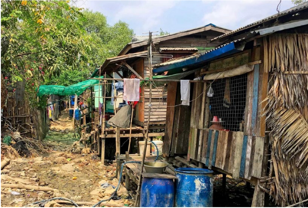
မြန်မာတနိုင်ငံလုံးရှိ လူဦးရေ စုစုပေါင်းရဲ့ ထက်ဝက် နီးပါး (၄၀ ရာခိုင်နှုန်း) ဟာ ကုလသမဂ္ဂကသတ်မှတ် ထားတဲ့ ဆင်းရဲမွဲတေမှုမျဉ်းရဲ့ အောက်မှာ ကျရောက်နေ

နိုင်စွမ်းအားကျဆင်းတယ်ဆိုတာ အိမ်ထောင်စုဝင်ငွေ ဟာ ငွေကြေးကိန်းဂဏန်းအရ လျော့နည်းမသွားဘဲ ကုန်ဈေးနှုန်းတွေတက်လာတဲ့အတွက် ကုန်ပစ္စည်းအရ နည်းသွားတာကို ဆိုလိုပါတယ်။ ဝင်ငွေကဒီဝင်ငွေပေ မဲ့ ပစ္စည်းအရနည်းသွားပါတယ်။ ကိုယ့်အိတ်ထဲကငွေ ဟာ အလိုလိုသေးသွားပါတယ်။ အဲသလိုကိုယ့်အိတ်ထဲ ကငွေကျသွားတဲ့နှုန်းဟာ ဒီနှစ်မှာ ၂.၃ ရာခိုင်နှုန်းဖြစ် ပြီး နောက်နှစ်မှာ ၁ ရာခိုင်နှုန်းလျော့ကျမယ်လို့ ခန့်မှန်း ထားပါတယ်။