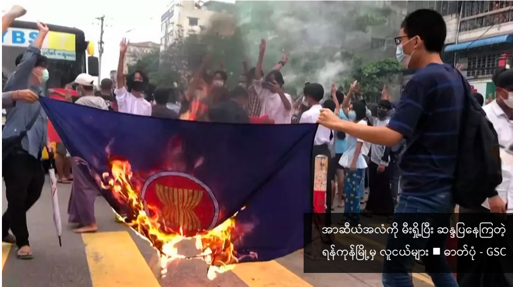
အာဆီယံအလံကို မီးရှို့ပြီး ဆန္ဒပြနေကြတဲ့ ရန်ကုန်မြို့မှ လူငယ်များ

ဦးဖြိုးဇေယျာသော်၊ ဦးဂျင်မီ နှင့် နိုင်ငံရေးအကျဉ်းသားများအား သေဒဏ်စီရင်မှုသည် အာဆီယံအခြေပြုစဉ်းစားချက်အား မှန်ကန်သောစဉ်းစားချက်ဖြစ်ရဲ့လားဟူသော ပြဿနာပေါ်ပေါက်လာပါသည်။ အာဆီယံနိုင်ငံများ၏ သဘောတူညီမှုဖြင့်ချမှတ်ထားသော အချက်ချချက်အား ပြောင်ပြောင်တင်းတင်းချိုးဖောက်နေသော အာဏာသိမ်းစစ်ခေါင်းဆောင်မင်းအောင်လှိုင် နှင့် အပေါင်းအပါများသည် ရက်စက်ပြီးရင်းရက်စက်နေကြနေကြသော်လည်း အာဆီယံအဖွဲ့အနေဖြင့် ထိရောက်သောဆောင်ရွက်ချက်များ ယခုအချိန်ထိ မဆောင်ရွက်နိုင်သေးသည်မှာ စိတ်ပျက်စရာပင် ဖြစ်သည်။