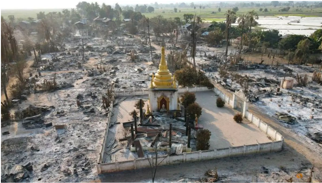
အာဏာသိမ်းစစ်တပ်ရဲ့ မီးရှို့ဖျက်ဆီးမှုကြောင့် ပြာကျသွားရတဲ့ စစ်ကိုင်းတိုင်းမှ ကျေးရွာတစ်ခုကို တွေ့မြင်ရပုံ

နေတယ်ဆိုတာကို တိတိကျကျသိမြင်စေဖို့ စာချုပ်ပါ မူရင်းအချက်အလက်တချို့ကို ဖော်ပြဖို့လိုအပ်လာပါတယ်။