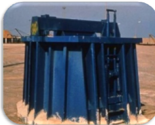
2. KHUÔN ĐÚC KHỐI - FORMWORK