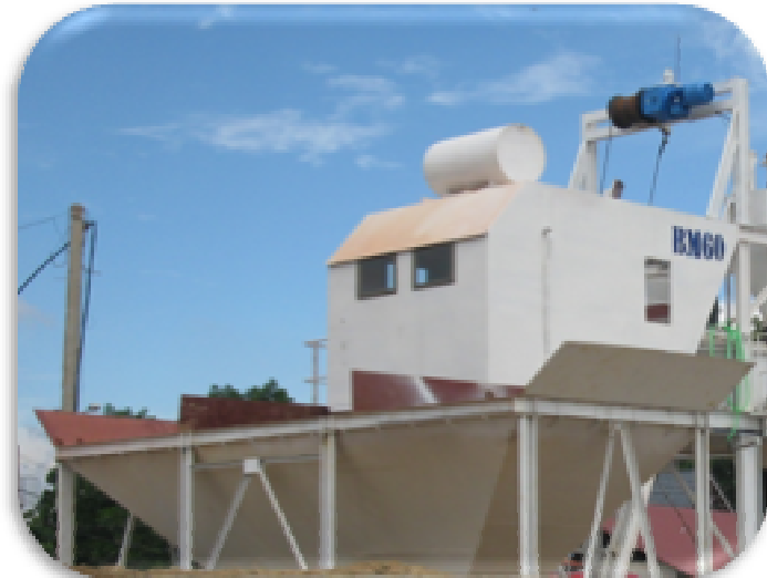
2. PHẾU CỐT LIỆU – INPUT MATERIAL HOPPER