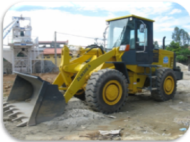
3. XE XÚC LẬT – PAYLOADER