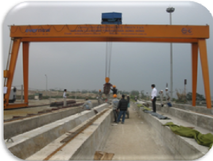
1. THIẾT BỊ SX CỌC VÁN BTCT – PC SHEET PILE EQUIPMENT