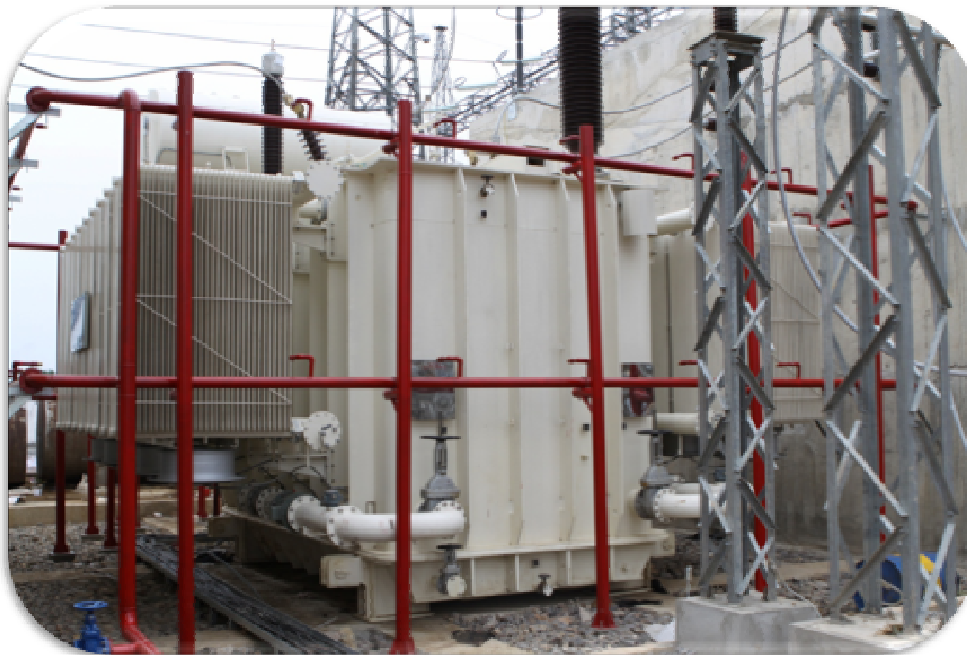
5. TRẠM BIẾN ÁP 500 KVA – TRANSFORMER STATION 500KVA