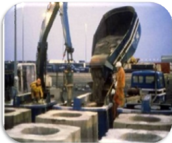
1. ĐỔ BÊ TÔNG – CASTING CONCRETE