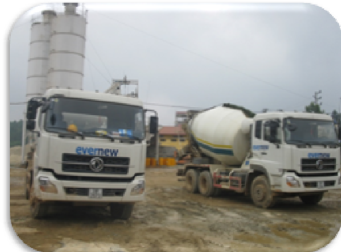
4. XE VẬN CHUYỂN BÊ TÔNG – MIXER TRUCK