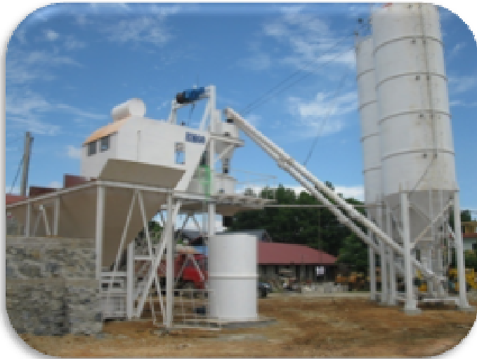
1. TRẠM TRỘN BÊ TÔNG – BATCHING PLANT