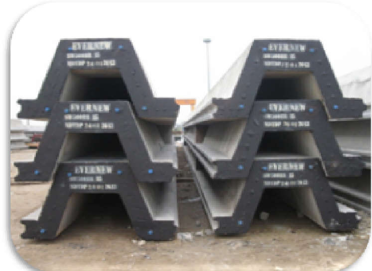
4. CỌC VÁN BTCT DỰ ỨNG LỰC – PC SHEET PILE