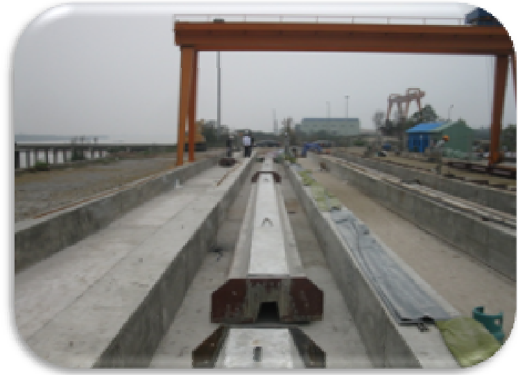
2. CỌC VÁN SAU KHI CẮT CÁP - AFTER CUTTING CABLE