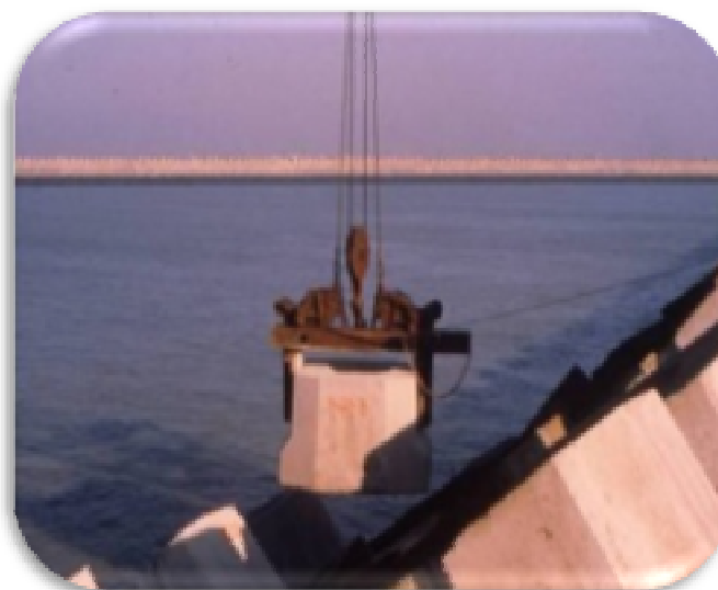
4. LẮP GHÉP – INSTALLATION