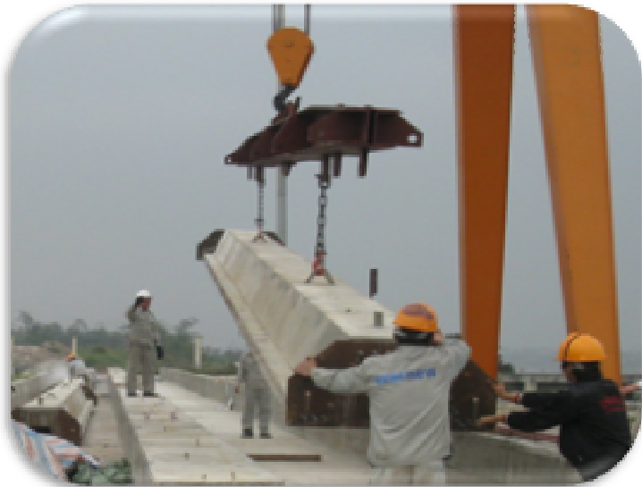
3. CẤU CỌC VÁN BTCT – LOADING PC SHEET PILE