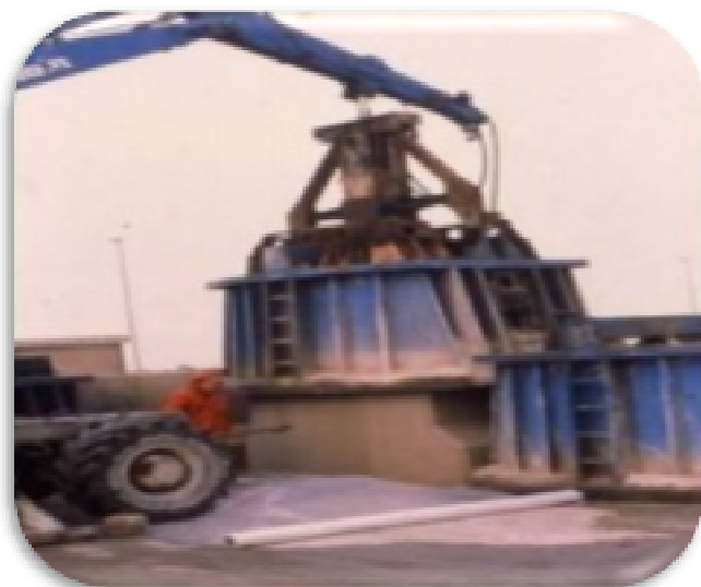
3. THÁO VÁN KHUÔN – REMOVE FORMWORK